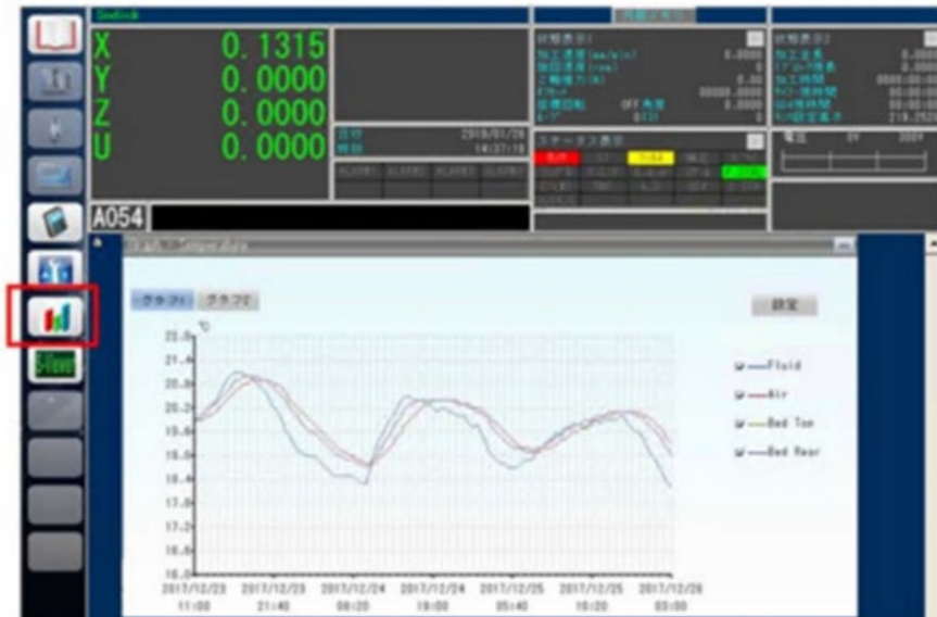
「温度見える化機能」をガジェットへ追加

これまで AL40G/AL60G でご好評をいただいている精密熱変位補正機能 TH COM を大型放電加工機「AL80G+」「AL100G+」に標準搭載しました。TH COM は、設置環境の温度変化、並びに Z 軸の高速ジャンプ時の熱影響、双方に対する変位を抑制します。また、機械要所の温度をグラフで見える化した機能を NC 装置のガジェットに搭載、長時間に及ぶ加工においてもより安定した精度が得られます。