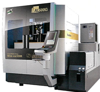
リニアモータ駆動 高速・高性能ワイヤ放電加工機 AL600G