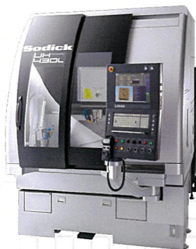
リニアモータ駆動 ウルトラハイスピード ミーリングセンター UH430L