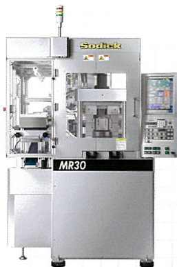
eV-LINE OPM金型専用 生産セルシステム MR30