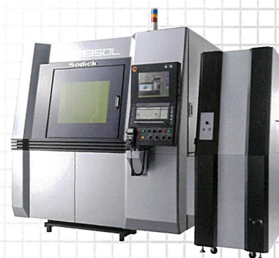
リニアモータ駆動 精密金属3Dプリンタ OPM350L