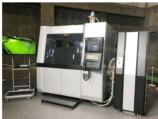
リニアモータ駆動 精密金属3Dプリンタ 「OPM350L」

その他、「Sodick - IoT」「ソディック製セラミックス」「MotionExpert ® - S」などの多数の展示をおこなっております。