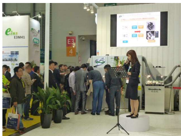
プレゼンテーション・コーナー