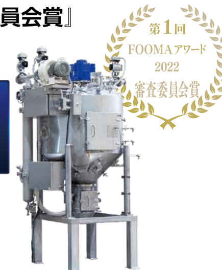
▲ 業界初、環境温度に影響されることなく粉粒体の温度管理が可能な「粉粒体急速冷却装置」