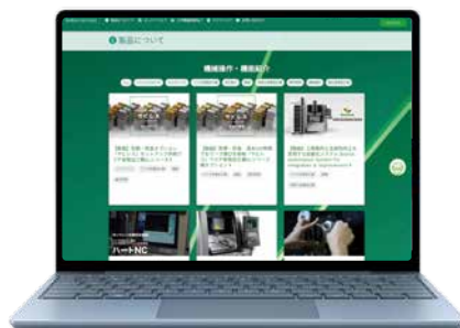
▲ 「Sodick Connect」現場で役立つさまざまな情報を配信

今後もお客様と長期的に良好な関係を構築できるようサポート体制の強化とサービスの改善に努めるとともに、同サイトから取得・蓄積したデータをトータルソリューションの提案に生かしてまいります。