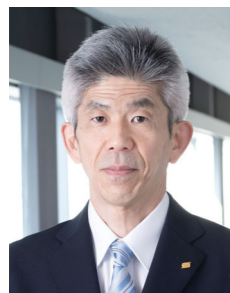
常務取締役 コーポレート部門統括担当

今後も、ステークホルダーの皆様との建設的な対話を通じて、企業力を磨き、企業価値の向上に努めてまいります。当社の経営および企業活動に対し、皆様の忌憚のないご意見をお寄せくださいますようお願い申し上げます。