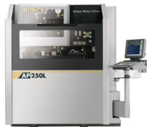
リニアモータ駆動 超精密ワイヤ放電加工機 AP250L