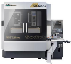
リニアモータ駆動 高速・高性能ワイヤ放電加工機 SLC600G