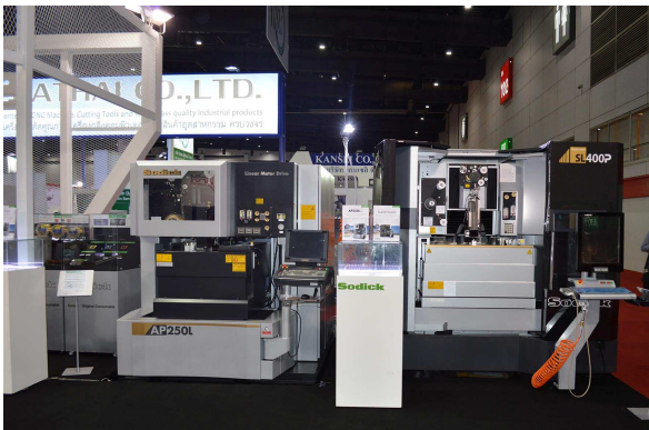
ソディックブース