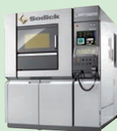
高速造形 金属3Dプリンタ