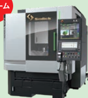
リニアモータ駆動 マシニングセンタ