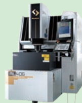
リニアモータ駆動 高速・高性能 精密形彫り放電加工機