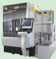
リニアモータ駆動 高速・高性能 ワイヤ放電加工機