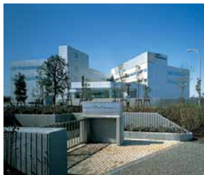
■ 本社 / 技術・研修センター